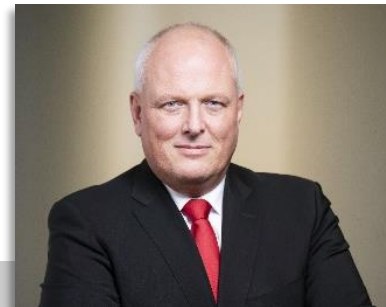
Prof. Ulrich Kelber Der Bundesbeauftragte für den Datenschutz und die Informationsfreiheit (BfDI)